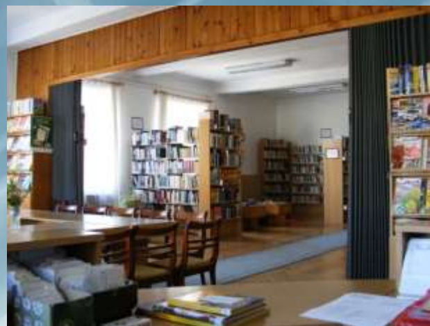
Községi és Iskolai Könyvtár